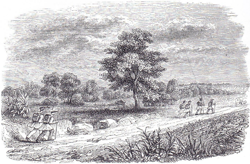
GRANDE ROUTE D'ARGOVIE